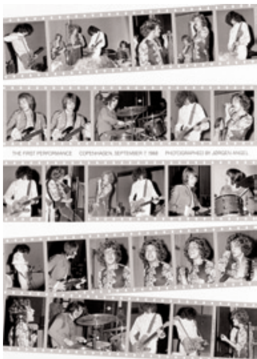
De bedste billeder fra Zeppelins verdenspremiere på et litografi, der kun er trykt i 750 eksemplarer. Det kan ses og købes på udstillingen på Gladsaxe Hovedbibliotek.

Teen Club'en vil gerne takke sponsorerne: