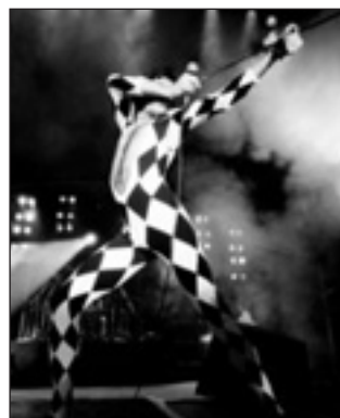
Freddy Mercury, der desværre senere døde af AIDS.

Store sal, Gladsaxe Hovedbibliotek, Søborg Hovedgade 220 viser Jørgen Angel over 400 fotografier og fortæller om tiden og sine mange oplevelser med kendte musikere. Billetter til foredraget er gratis og kan bestilles fra 1. september i alle Gladsaxe-biblioteker eller via bibliotekets hjemmeside: www.glad-saxebibliotek.dk .