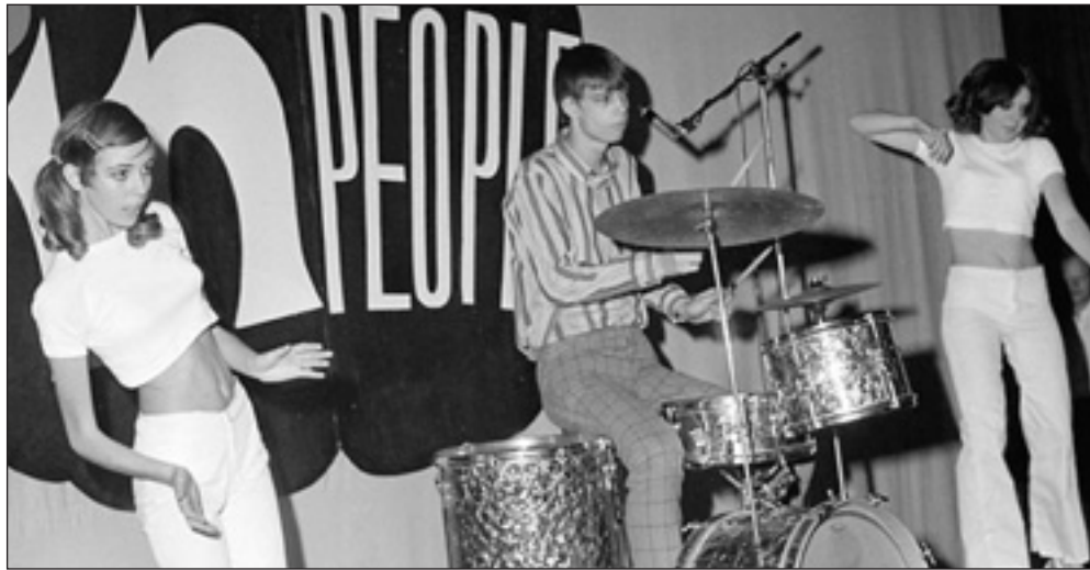
Et par medarbejderpiger som go-go dansere i ens dress, de selv havde syet.

Midt i tresserne flokkedes Gladsaxe-ungdommen til bal med tidens mest populære popgrupper lørdag aften – primært på Egegård skole