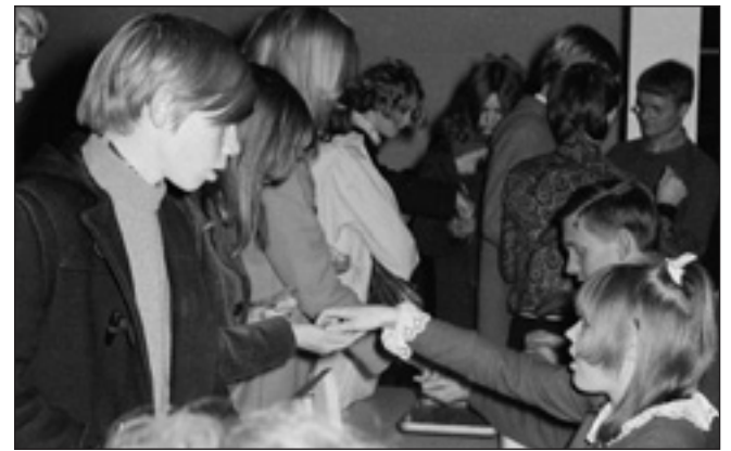
Der var stort pres ved indgangen, når de unge mennesker ville ind og se idolorkestrene.

hyggelige, gode og ædru medarbejdere ved arrangementerne. En lidt speciel opgave var den såkaldte lokumstjans. Ligesom de øvrige dele af skolen, hvor medlemmer eller medarbejdere havde været i løbet af en aften, skulle der også gøres rent på toiletterne. Det kunne ikke undgås, at der en gang imellem var et par medlemmer, som havde drukket spiritus inden de kom eller havde smuglet en lommelærke med ind. Nogle af disse ofrede sig på et tidspunkt på toiletterne, så det var ikke den mest populære opgave at gøre rent efter dem. Men der skulle spules og gøres rent – og det blev altid klaret. På et tidspunkt tilbød to piger, at de gerne ville være go-go girls, hvilket ville sige, at de stod og dansede på nogle podier på scenen. Pigerne bekostede og syede selv nogle ens dragter