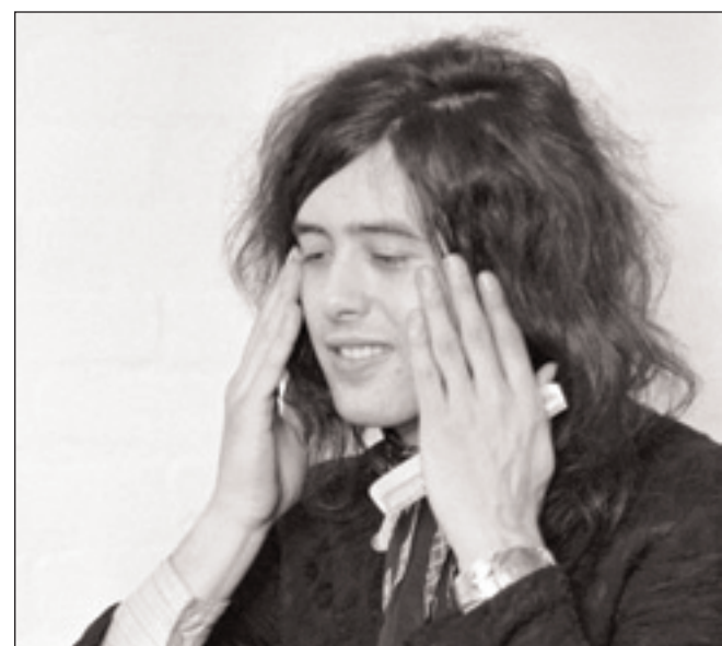
Jimmy Page på Egegård Skole 15. marts 1969. Af alle Jørgen Angels billeder på udstillingen i Stockholm var der et, som Jimmy Page ikke kunne lide. "Hvorfor ikke? Fordi du ser nuttet ud?" spurgte fotografen. "Ja", svarede Page småsurt. "Jeg vil ikke se nuttet ud".